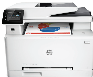
HP Color LaserJet Pro MFP M277dw

Du hadde aldri forventet deg så mye ytelse fra en så liten pakke. Kombinasjonen av denne fullstede MFPen og originale HP-tonerkassetter gir deg verktøyene du trenger for å få jobben gjort.